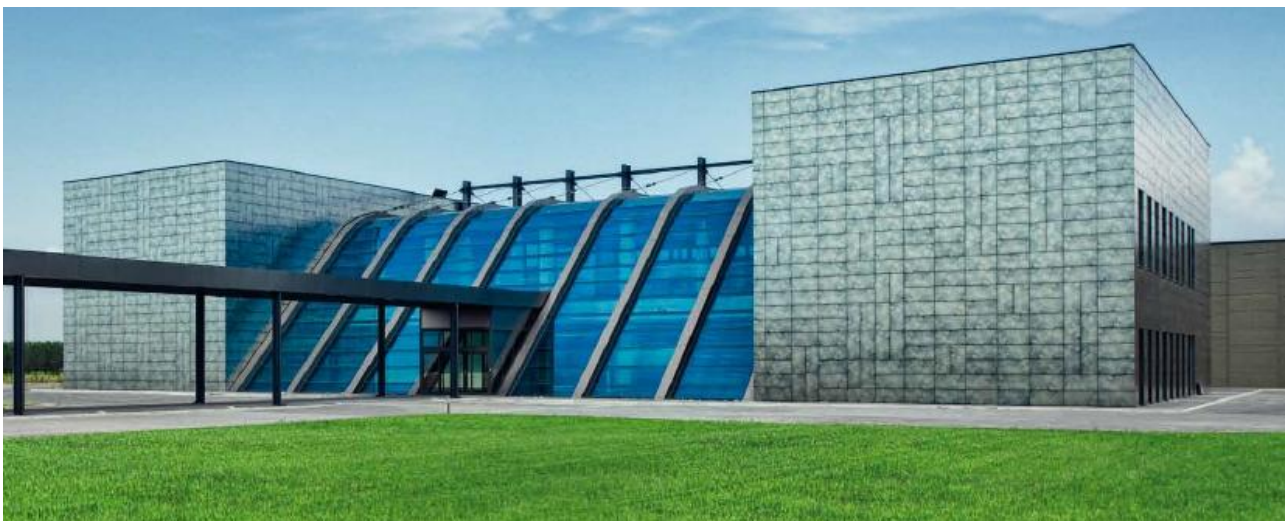
Palazzo ExpoPiemonte: Complesso dove si svolgerà la Fiera

Asperia dal 1996 collabora con gli altri attori del territorio quali la provincia di Alessandria, le Fondazioni bancarie, la regione Piemonte, il comune di Alessandria ed altri enti locali nell'organizzazione di eventi, progetti, fiere e mostre.